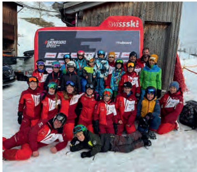
und bei der Speed Tour in Amden