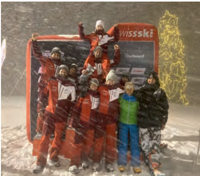
Die Ammler Boarder beim Night-GS am Flumserberg...