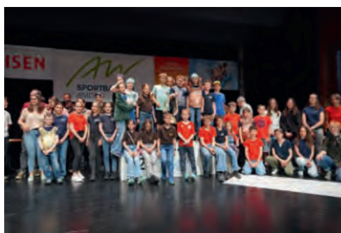
Der Gesamtsieg ging ebenfalls nach Amden