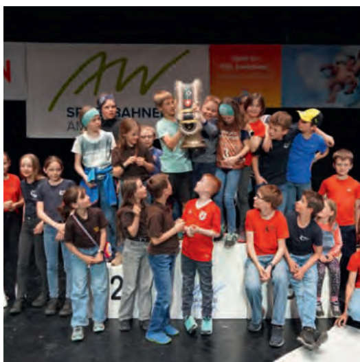
LinthCup Absenden in Amden - Sieg in der Gesamtwertung wird gefeiert